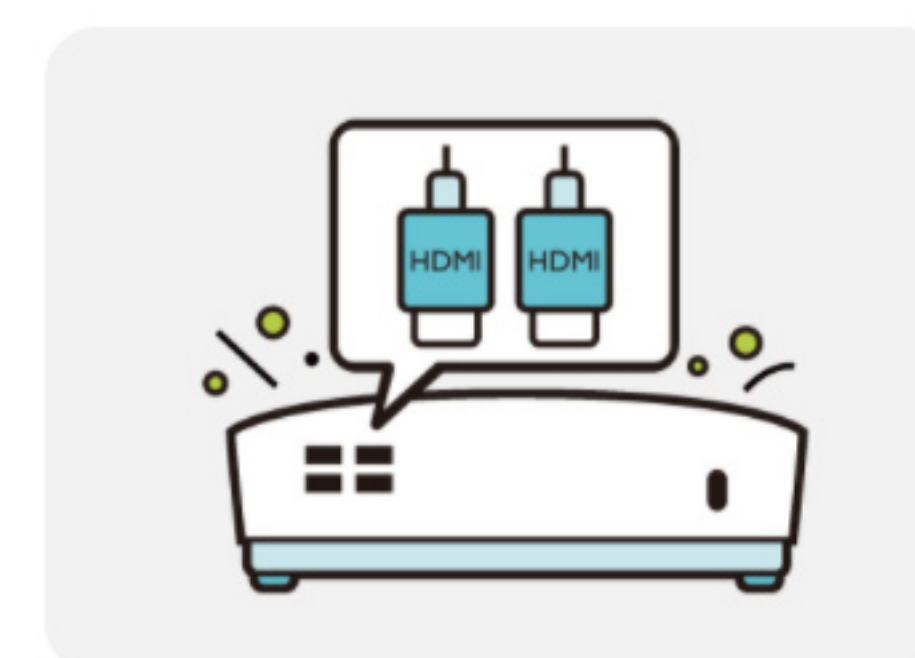
Doble Entrada HDMI